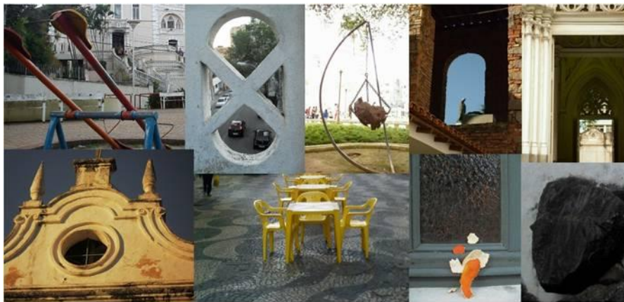
Figura 2. Exemplo das imagens dos “portais” utilizados para os respectivos “espaços” no mapa de Rugosidades Espaciais. Um exemplo de Mapa Híbrido.

Para dar voz a essas multiplicidades no mapa, buscamos articular linguagens diversas, imagéticas ou não, que “falem” da espacialidade e seu processo de produção até a contemporaneidade. Trabalhamos com o centro de Vitória-ES (Figura 2 e Figura 3)