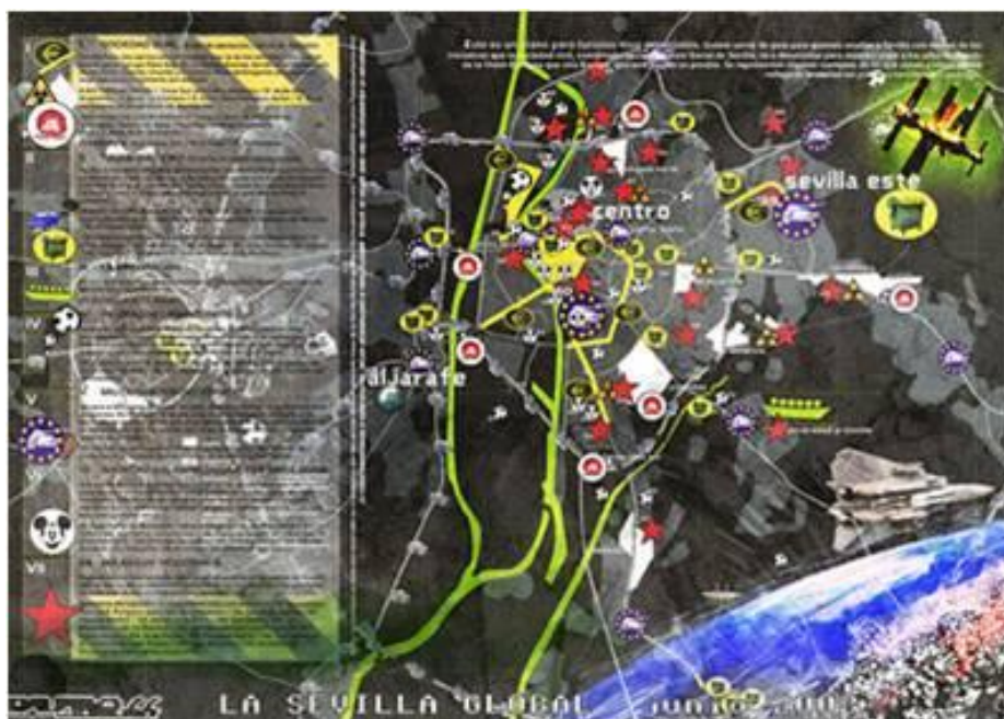
Figura 4. La Sevilla Global: Exemplo de Cybercartografia Ativista a partir do território de Sevilha (Espanha).

Nas entrelinhas de um regime que sufoca as potencialidades múltiplas de ação e expressão no espaço – a partir do cyberspaço -, dispõem-se possibilidades ricas de protagonismo sócio-espacial e são nessas entrelinhas em que agem, hoje, grupos dedicados a dar visibilidade a perspectivas que problematizam o espaço, e a construir ações políticas fortes de atuação sócio-espacial, a partir do uso da cartografia (Figura 4).